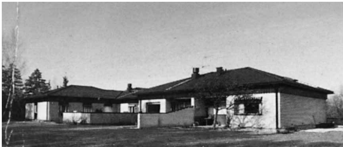
Nya Björka i Bromma invigdes år 1968.